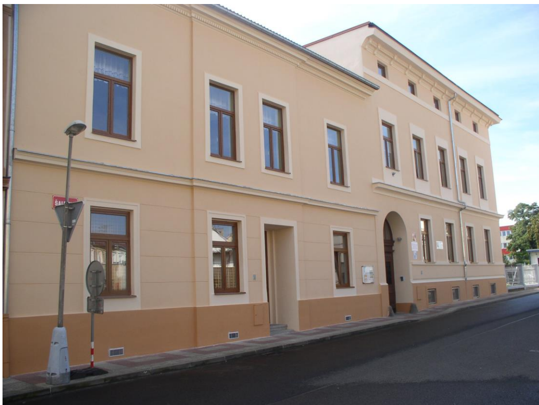
budova Praktické školy dvouleté